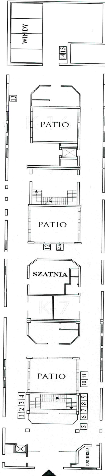
Rozmieszczenie stanowisk na poziomie "0" Szpitala